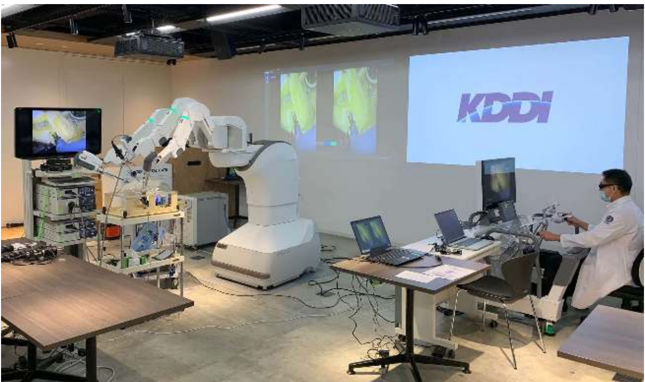
<5G SAとMECによるロボット操作と複数モニターへの低遅延映像伝送の様子>